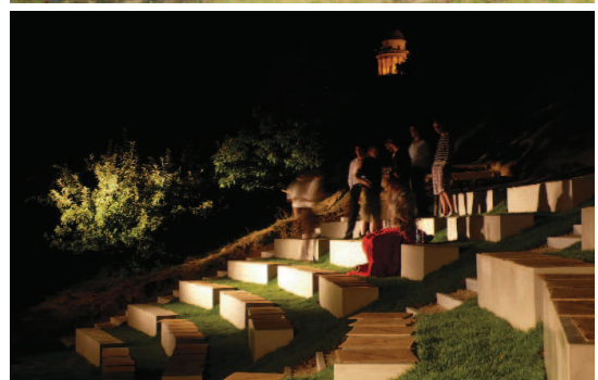
LABIRINTUS és SZABADTÉRI SZÍNHÁZ a Pannonhalmi Főapátság kertjében