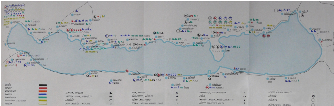
Regionális Terv Műemléki vizsgálat (3)