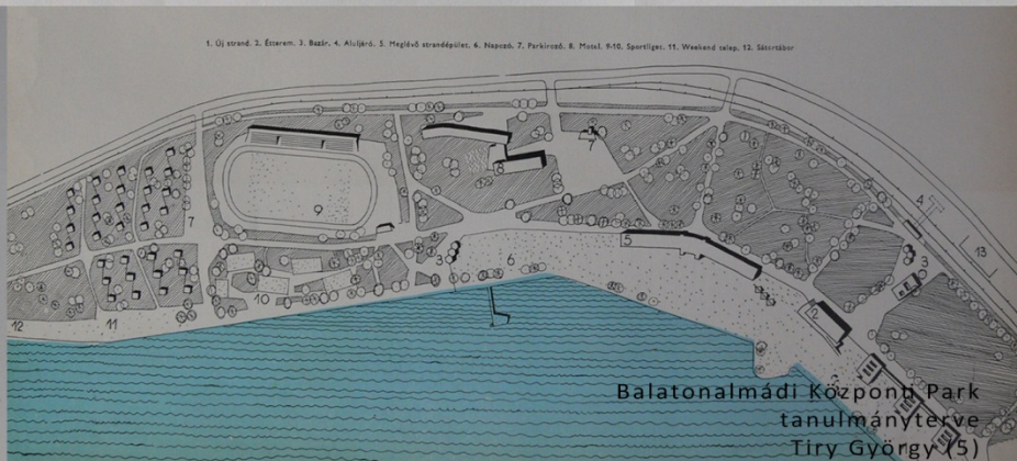
Balatonalmádi Közpark tanulmányterve Tiry György (5)