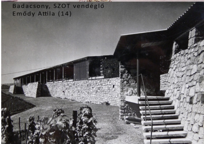
Badacsony, SZOT vendéglő Emődý Attila (14)