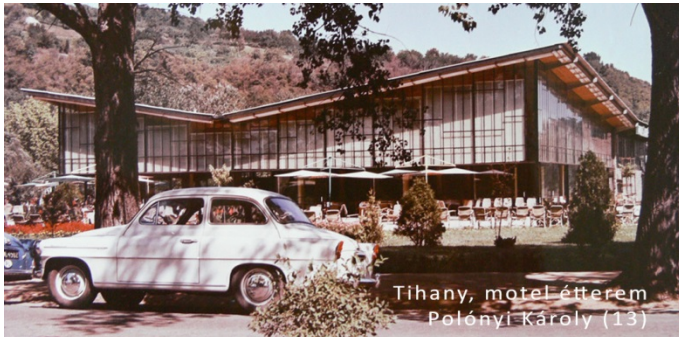
Tihany, motel-étterem Polónyi Károly (13)