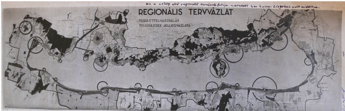
Regionális Tervvázlat (1)